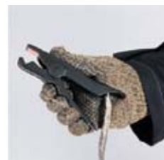
контактный зажим переноса потенциала