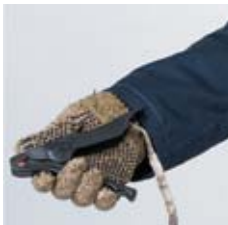
контактный зажим переноса потенциала